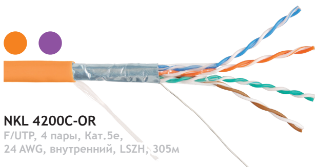
NKL 4200C-OR F/UTP, 4 пары, Кат.5е, 24 AWG, внутренний, LSZH, 305м

Маркировочная надпись: NIKOMAX NETWORK SOLUTIONS /// NIKOLAN NKL 4200C-OR F/UTP SOLID CABLE 4P CATEGORY 5E 24AWG Class Dca-s2,d2,a1 LSZH ( Hr(A)-HFLTx ) ISO/IEC 11801 & EN 50173 & ANSI/TIA/EIA-568 NVP 0.69 (ZL) 1810 052M