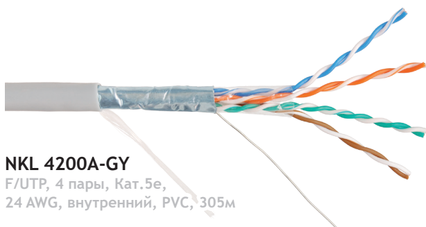
NKL 4200A-GY F/UTP, 4 пары, Кат.5е, 24 AWG, внутренний, PVC, 305м

Маркировочная надпись: NIKOMAX NETWORK SOLUTIONS /// NIKOLAN NKL 4200A-GY F/UTP SOLID CABLE 4P CATEGORY 5E 24AWG Class Eca PVC ( Hr(A) ) ISO/IEC 11801 & EN 50173 & ANSI/TIA/EIA-568 NVP 0.69 (ZL) 1810 052M